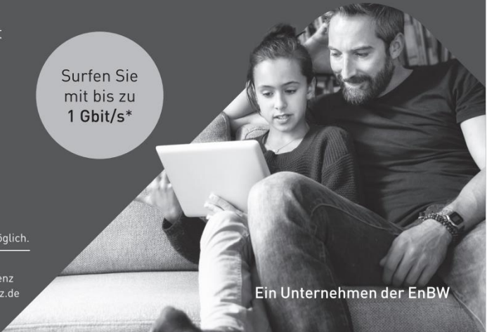
Ein Unternehmen der EnBW