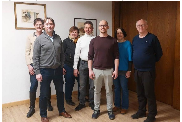
Wahlhelfer/innen in Untermedlingen

Falls Sie sich bei den kommenden Wahlen für die Aufgabe des Wahlhelfers interessieren, können Sie sich gerne an das Wahlamt (Tel. 09073 999-237 oder Email: ordnungsamt@gundelfingen-donau.de ) oder an die Gemeinde Medlingen (Tel. 09073-7366, email: gemeinde@medlingen.de ) wenden.